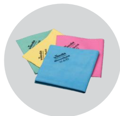
Салфетки МикронКвик желтые (цвет дезинфекции)