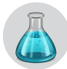
Разрешённый дезинфицирующий раствор