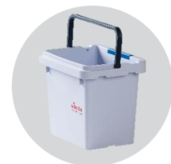
Ведро с крышкой Ориго 2 4,5 л